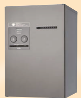
暗証番号で開錠、キーレスタイプ COMBO-Maison