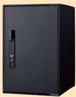
発送もおまかせできる電子錠タイプ e-COMBO LIGHT

Panasonic 宅配ボックスコンボシリーズ! で 『2024年問題』を解決しましょう!