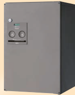
宅配ボックスのスタンダード COMBO