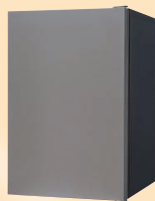
フラットなすっきりデザイン COMBO-FLAT