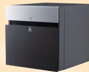
コンボにポストをプラス COMBO-F