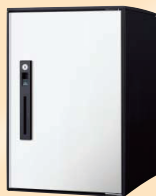
手軽に設置、後付けにもおすすめ COMBO-LIGHT